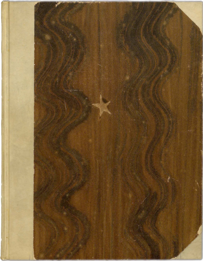
6 Einband von Exp. Nr. 52 (RWZ, Sig. WB 13.1), Halbpergament mit Musterpapier