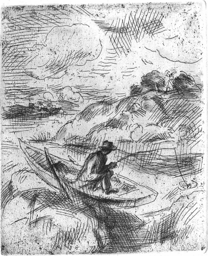
4 Unpaginiert eingebundene Radierung, Karl Walser, Seite [128a]