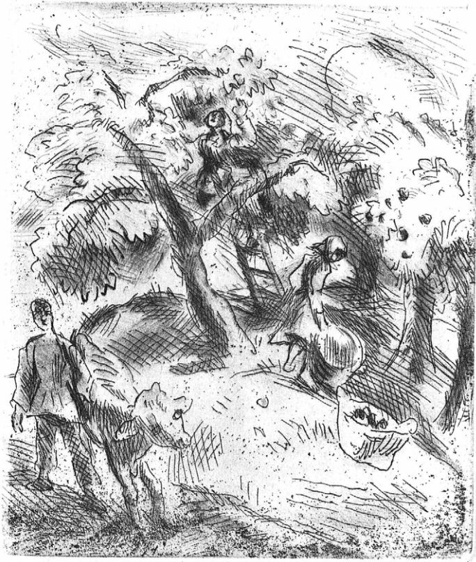
1 Unpaginiert eingebundene Radierung, Karl Walser, Seite [32a]