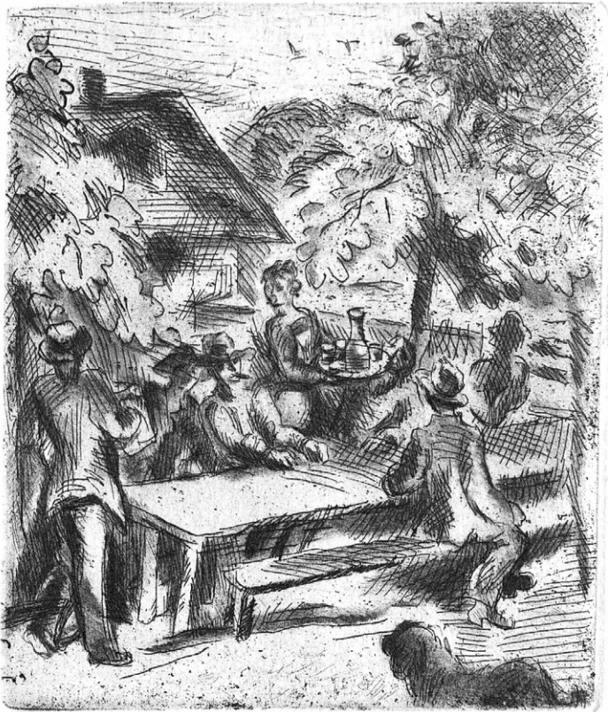
2 Unpaginiert eingebundene Radierung, Karl Walser, Seite [56a]