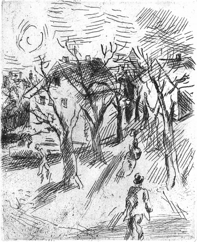
5 Unpaginiert eingebundener Radierung, Karl Walser, Seite [168a]